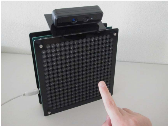
図 2 フレズニオス(ハンドトラッキング+触覚提示の例)